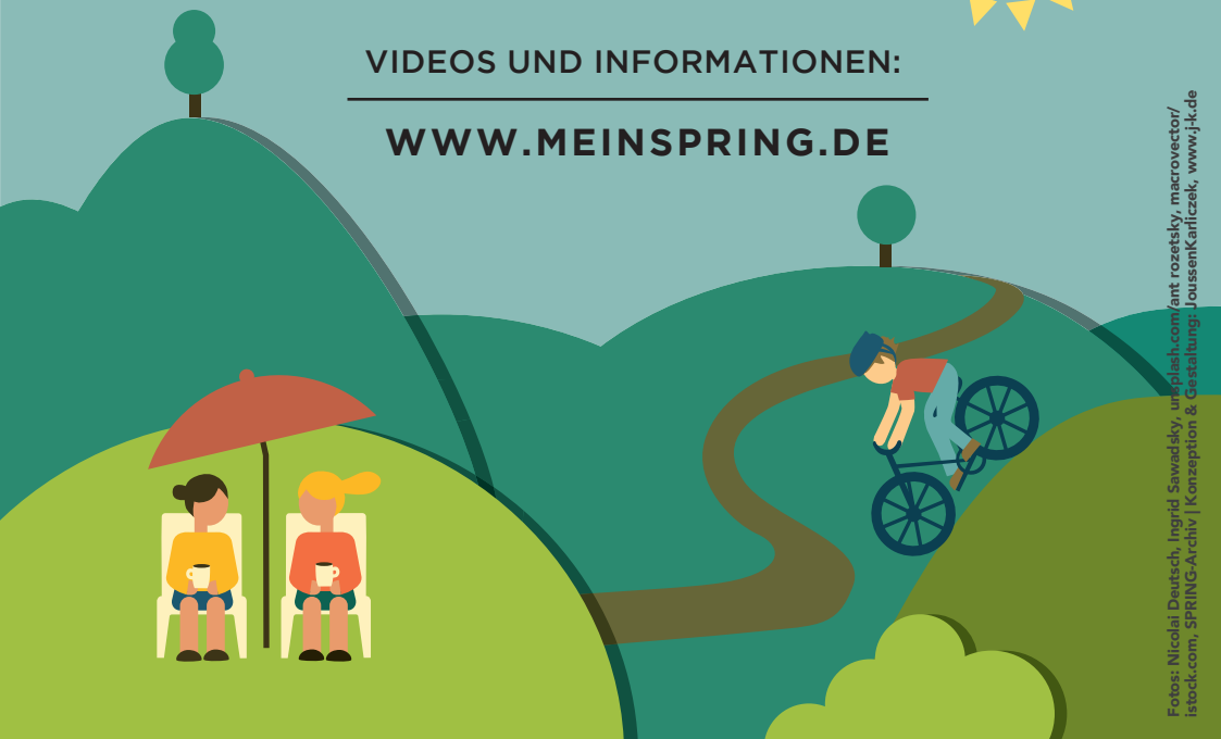
Konzeption & Gestaltung: JoussenKarfczek, www.jk.de

Am Einfachsten anmelden auf www.meinspring.de . Sie erhalten dort sofort eine Anmeldebestätigung. Oder die ausgefüllte Anmeldung per Post an umseitige Anmeldeadresse senden, oder per Fax an 036741 21200.